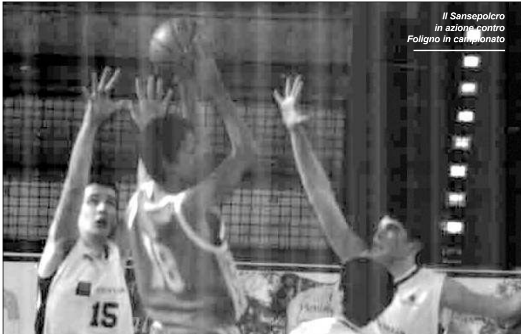
Il Sansepolcro in azione contro Foligno in campionato