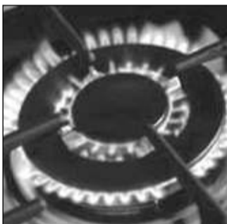
Pesanti rincar per il gas

L'arco temporale esaminato è quello che va dal marzo 2004 al marzo 2006 e le tariffe sono mediamente cresciute del 20% (molto più dell'inflazione) con una certa differenziazione tra i territori. Infatti, le Marche e la Toscana fanno registrare una crescita superiore alla media, pari rispettivamente al 24,3% e al 23,9% mentre l'Umbria si assesta al +18,1% seguita dal Lazio con un +15,6%.