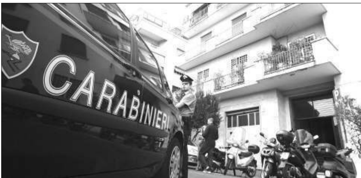
I carabinieri indagano sul fatto

mezzo fa e, fra l'altro, era stata in qualche modo "agevolata" (pare) da una porta lasciata sbadatamente socchiusa.