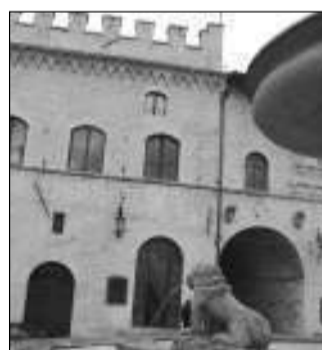
Il Comune di Assisi

ASSISI - La Fondazione internazionale Assisi, in collaborazione con la Scuola di etica ed economia di Assisi e con il patrocinio del Comune di Assisi ha organizzato, per il giorno 24 novembre, dalle ore 9,30 alle ore 11 presso la sala della Conciliazione del Palazzo dei Priori un convegno 'Io e l'altro: l'etica a confronto'. Nell'ambito del seminario 'Dalla terra di Francesco per una nuova via' la Fondazione Interna-