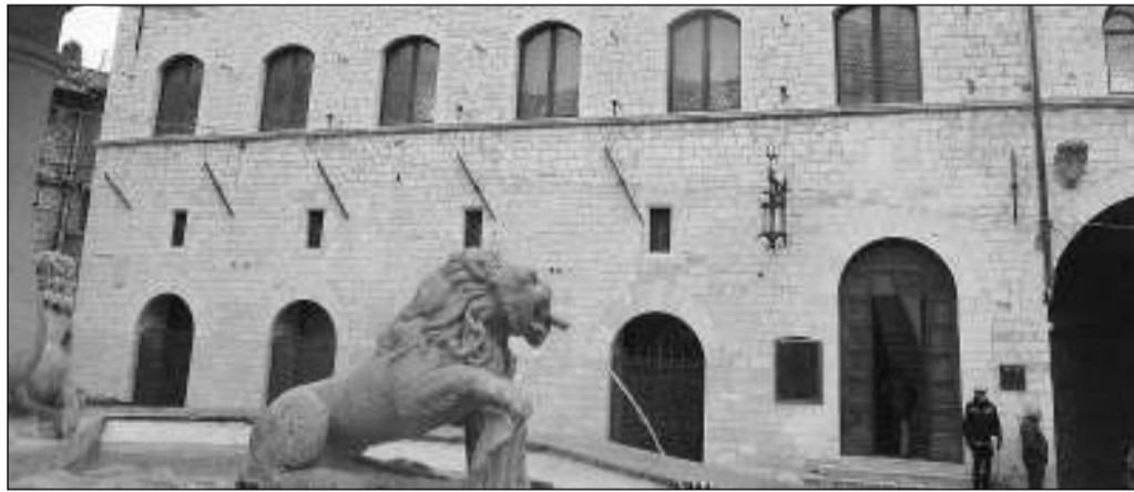
Domani riunione dei Ds per individuare il nome del candidato a sindaco dell'Unione in vista delle prossime elezioni ad Assisi