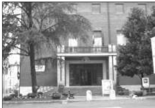
Il Comune di Bastia Umbra

le condizioni meteorologiche lo renderanno possibile - assicura l'assessore Marchi - la ditta provvederà a proprie spese alla fresatura dell'asfalto nelle tre vie interessate ed al rifacimento del tappetino stradale. Nel frattempo le condizioni di sicurezza saranno garantite con interventi tesi ad evitare l'ulteriore sfaldamento dell'asfalto ed il rifacimento nei punti in cui è saltato". L'assessore ai lavori pubblici