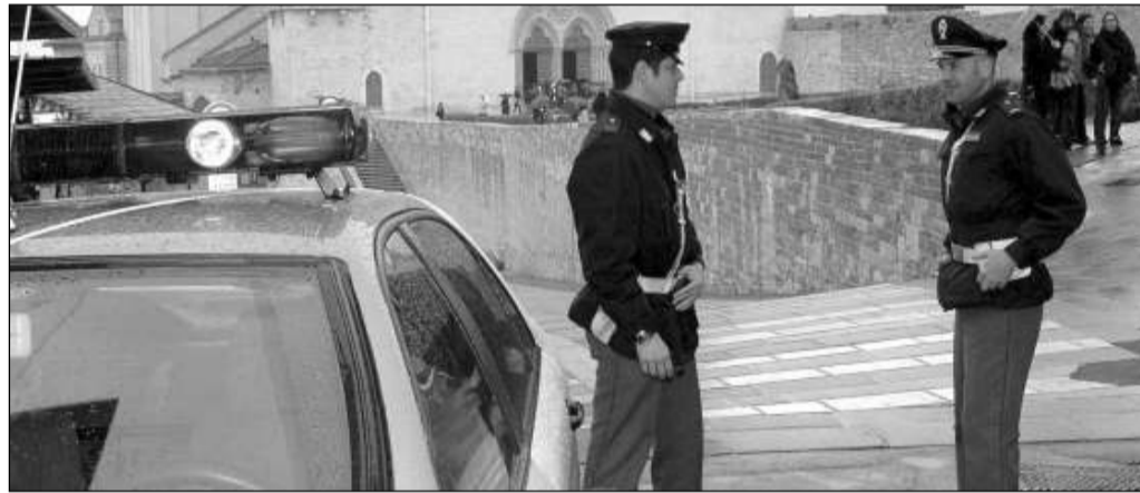
Il commissariato di polizia di Assisi continua ad avere problemi per la sua sistemazione logistica

ASSISI - Un commissariato che non ha i requisiti necessari. In cui gli agenti sono costretti a lavorare con grande disagio. E' quanto emerge da una nota presentata dal Silp (Sindacato italiano lavoratori di polizia) in merito alla sede della polizia di Stato di Assisi. "Come già denunciato più volte - si legge in una nota - da circa 10 anni i colleghi si trovano ad operare in una sede fatiscente e priva di qualsiasi requisito minimo previsto dalla legge 626 in merito alla sicurezza dei lavoratori. I cittadini, soprattutto i disabili che si rivolgono alla struttura trovano difficoltà oggettive insor-