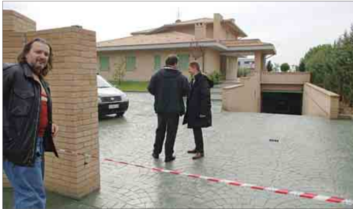
La villa di Bastia Umbra dove è avvenuto l'assalto