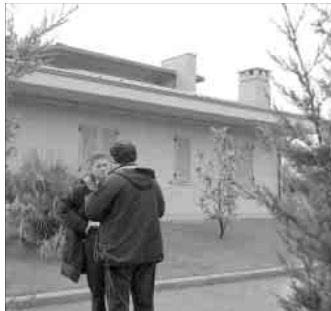
Rapina L'abitazione dell'imprenditore malmenato e rapinato. La banda, forse di sei persone, ha atteso il suo rientro dal lavoro.