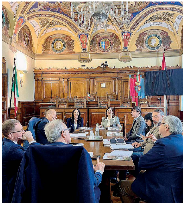
Confronto tra amministratori Per avviare sinergie in vista degli effetti dell'Anno Santo nei rispettivi territori

Nei prossimi mesi, è prevista anche la firma di un protocollo d'intesa fra i due Comuni, che continuerà anche dopo la scadenza dell'anno giubilare, nel quale la città serafica vedrà un afflusso record: solo le previsioni della tassa di soggiorno, già al top negli anni precedenti, parlano di oltre 2.200.000 euro nelle casse