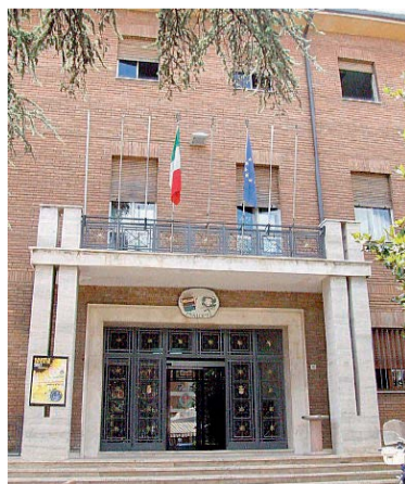
Comune Bastia Umbra Bilancio e polemiche

"di aumento dell'esenzione addizionale Irpef per le fasce più deboli e la riduzione del 75% della Tari per le attività commerciali del centro storico e di via Roma coinvolte dai disagi dei lavori. Non vi è alcuna risorsa aggiuntiva nelle spese correnti per le manutenzioni ordinarie, la programmazione delle opere pubbliche è un copia e incolla di quella approvata dalla scorsa amministrazione, eliminando il previsto rifacimento della pista di atletica sostituendola con piccoli interventi molto meno urgenti.