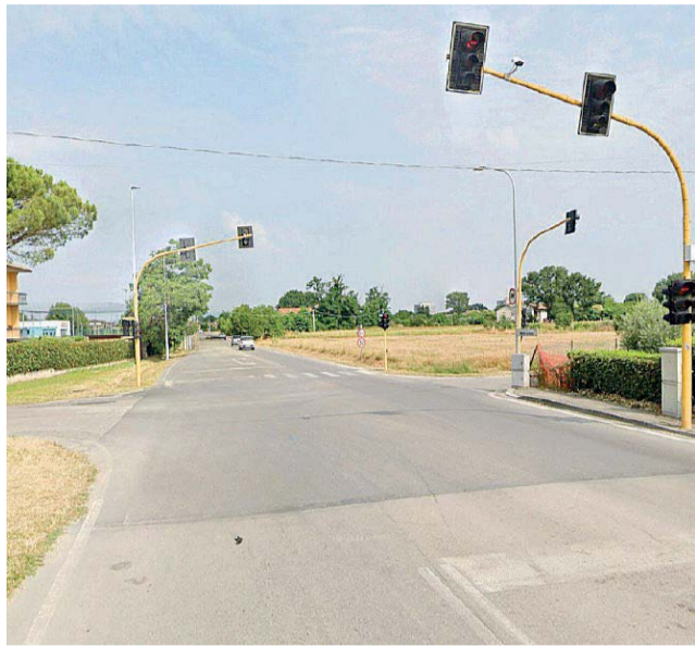
Impianto semaforico Il T-Red sta facendo discutere gli automobilisti che riuniti in un comitato si incontrano questa sera