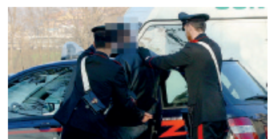
ALL'OPERA S.F. Una pattuglia dei carabinieri

Lo straniero è risultato essere clandestino sul territorio nazionale ed era in possesso di un documento di identificazione greco contraffatto, utilizzato per dissimulare uno stato di regolarità in materia di immigrazione. Ha già affrontato il processo per direttissima, a seguito del quale è stata disposta la custodia cautelare in carcere: per lui si sono aperte, dunque, le porte della casa circondariale di Perugia ove è stato condotto.