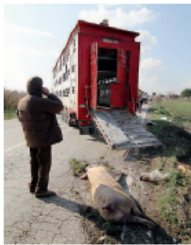
TRAFFICO BLOCCATO Nelle foto di Pietro Crocchioni il difficile recupero degli animali coinvolti nell'incidente

L'incidente nella notte: complicata l'opera di recupero