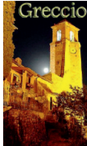
FASCINO La Natività allestita nella parte più antica della città

La chiesa Benedettina di San Filippo e Giacomo è il luogo dove è stata allestita la Natività e tutt'intorno alla cappella vari scenari. Una quarantina di personaggi con costumi d'epoca, i Re Magi, un gregge di pecore, fanno da corollario alla Natività. Il mastio triangolare, uno dei più alti d'Italia, è illuminato in maniera tale da rendere l'evento ancora più suggestivo. Le vie di accesso del centro storico sono addobbate a festa con un sottofondo di musica natalizia che accompagnerà i visitatori. La realizzazione di visite guidate in costume rinascimentale contribuiranno inoltre a caratterizzare ancora di più il Presepe. L'orario di apertura va dalle 9,30 alle 18,30. L'ingresso è libero.