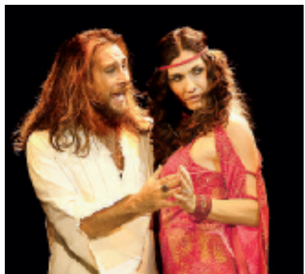
EVERGREEN Due immagini del grandioso musical che sarà in scena al Lyrick di Assisi mercoledì e giovedì sera