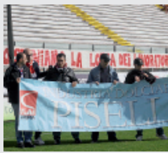
UNIONE Tifo & sostegno

nota —. I lavoratori della Piselli chiedono il vostro sostegno nel portare avanti la nostra azione per la salvaguardia del lavoro. Piselli, simbolo della nostra città non può e non deve essere lasciato morire. Grazie». In appoggio ai lavoratori, uno striscione degli Ingrifati: «sosteniamo la lotta dei lavoratori di Piselli».