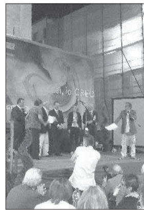
Festa In piazza