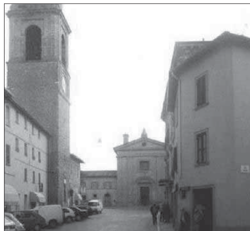
Sotto tiro Petrignano è stata colpita da una serie di furti che hanno interessato anche altre aree del comune di Assisi

Doppio furto ai danni di un'azienda edile di Petrignano