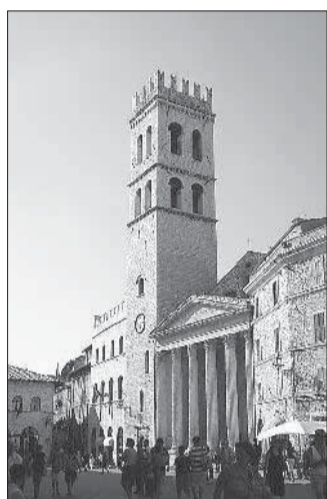
Polemica sui rifiuti

ASSISI - "Tutte le attività commerciali del Comune di Assisi sono servite dalla raccolta 'porta a porta' dall'Ecocave che comprende carta, plastica, vetro, cartoni: ovviamente, però, bisogna farne richiesta": così il Comune replica alle lamentele di alcuni commercianti, tra cui qualche edicolante, che segnalava di essere 'costretto' a recarsi a Santa Maria degli Angeli per smaltire carta e cartone. "Quasi tutte le attività del Comune usufruiscono del servizio offerto da Ecocave - aggiunge la nota del Comune - ed i contenitori per la raccolta della carta sono posizionati in modo da coprire interamente il capoluogo di Assisi, e sono ubicati nella piazzetta della Chiesa Nuova per il centro storico, un secondo a san Pietro per la parte bassa della città, il terzo in via Eremito delle carceri per quella alta, ed il quarto fuori Porta san Giacomo, al servizio anche dell'area intorno alla basilica di san Francesco".