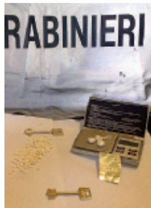
IL SEQUESTRO Parte della droga recuperata