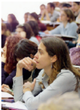
PROSPETTIVE Gli studenti sperano