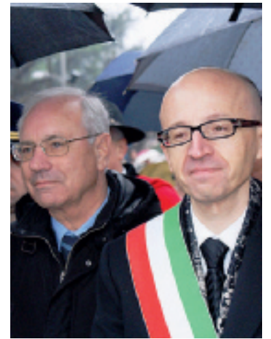
AI FERRI CORTI Ricci e Bartolini

TODI RAID NOTTURNO A PANTALLA. E DURANTE IL FURTO TROVANO IL TEMPO DI MANGIARE