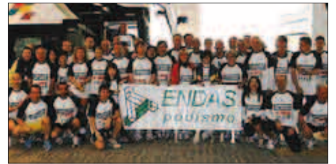
L'Endas c'è il gruppo dei podisti umbri a Onna

PERUGIA - Erano oltre cento gli umbri che domenica scorsa hanno partecipato alla Corri in Abruzzo, la gara podistica di 10 chilometri con partenza da L'Aquila ed arrivo ad Onna e di questi 80 facevano parte dell'Endas Podismo Umbria, gruppo che ha raccolto i tesseri di varie società umbre affiliate all'Endas. Parlare di risultati tecnici per una manifestazione come questa, dove contava solamente esserci visto lo scopo che si proponeva, è superfluo. Per tutti è stata un'esperienza forte, vissuta in maniera particolare insieme ad oltre tremila persone di varie parti d'Italia che con la loro presenza hanno voluto testimoniare la propria solidarietà all'Abruzzo. L'Endas Podismo Umbria si è classificata settima nella graduatoria per società, e il premio in denaro vinto è stato donato in beneficenza insieme ad una ulteriore somma raccolta tra i partecipanti del gruppo che hanno corso con una maglia in cui campeggiava la scritta "L'Umbria corre per l'Abruzzo". E' stata una gara in cui l'agonismo è passato in secondo ordine, l'emozione che ha provocato il correre in certi luoghi ha superato di gran lunga il risultato cronometrico, perché domenica in Abruzzo l'importante era esserci, a testimoniare la solidarietà di tutti verso quelle popolazioni così duramente colpite dal terremoto.