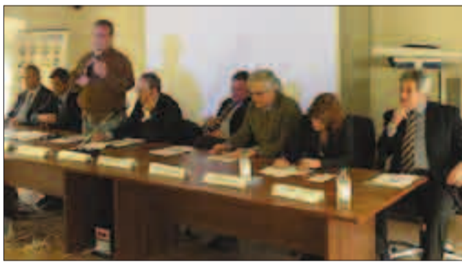
La discussione I relatori al convegno di Spoleto