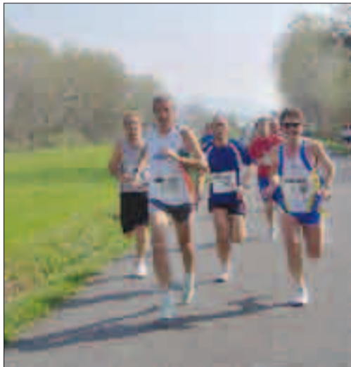
Di corsa Una delle edizioni degli anni passati del trofeo Ap Solomeo

per le gare giovani, che si svolgeranno nel percorso verde intorno agli impianti sportivi.